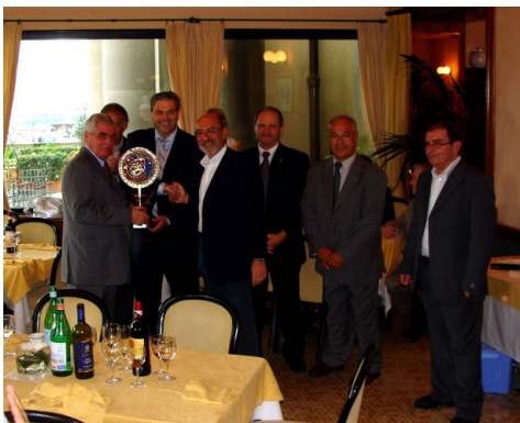
Quest'anno il trofeo è della Toscana